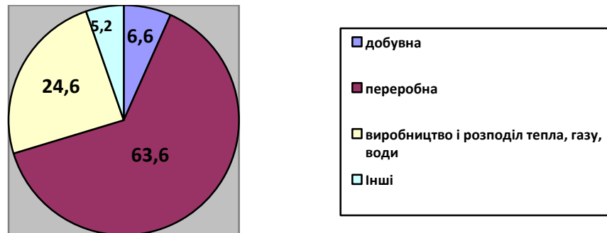
Структура обсягів реалізованої продукції, %

Підприємства переробної промисловості займають найбільш вагомую частку в загальному обсязі реалізованої продукції – 204,9 млн. грн. (63,6 %); виробництво і розподіл тепла, газу, води – 79,1 млн. грн. (24,6 %), добувна промисловість становитиме 21,3 млн. грн. (6,6 %), інші (реалізація деревини) – 16,6 млн. грн. (5,2%).