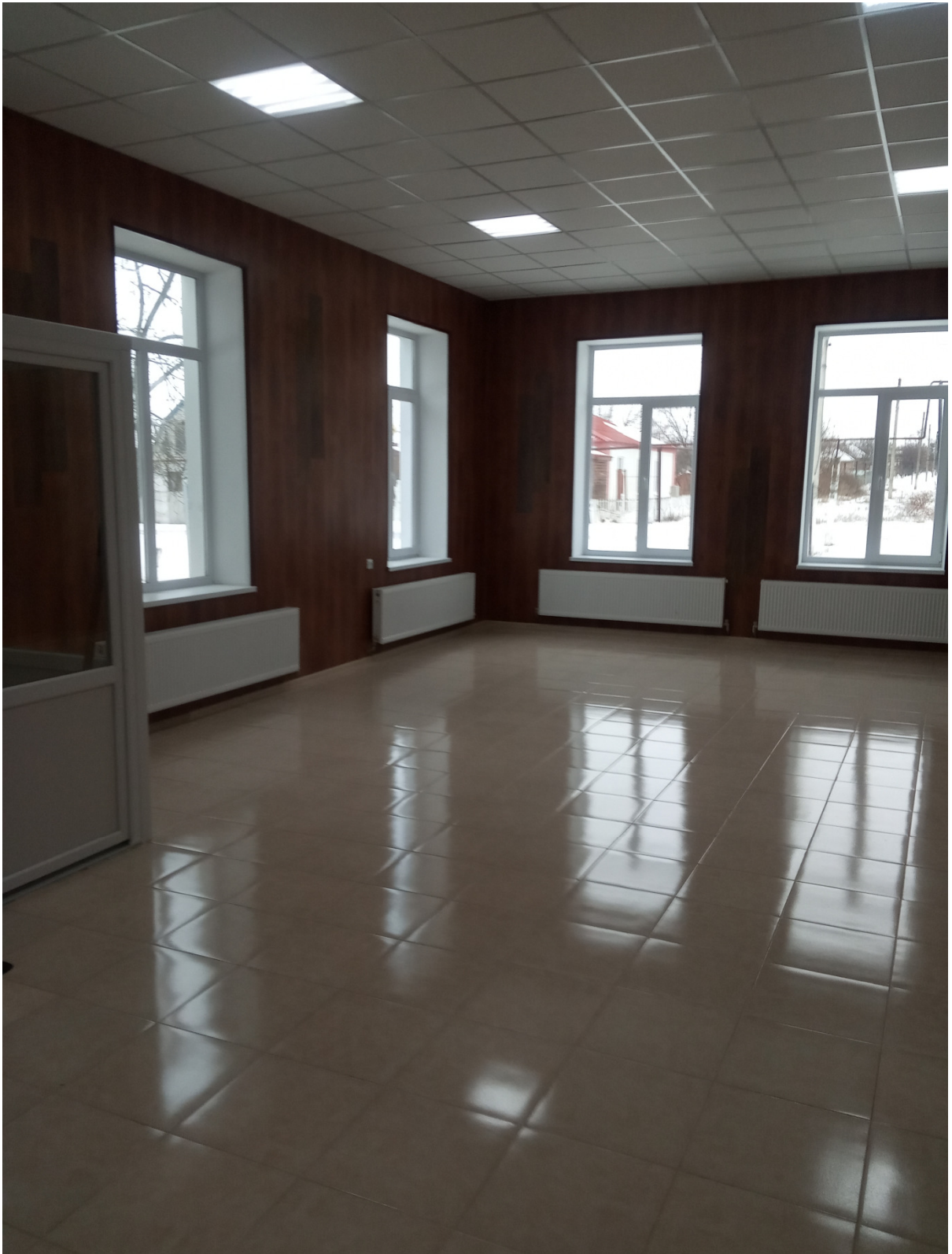
Поточний ремонт фойє ЦКД с.Рубці - 154,411 тис.грн.