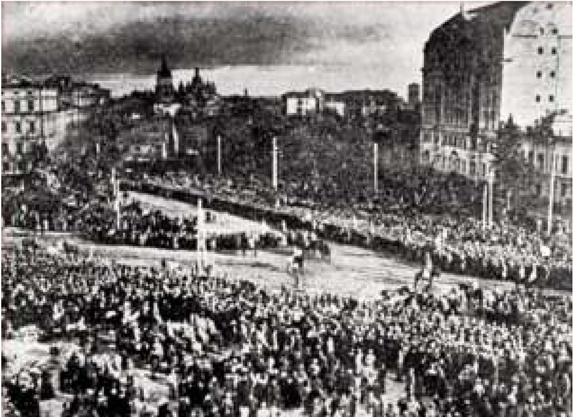
Мітинг на Софіївській площі з нагоди проголошення Акта злуки Української Народної Республіки та Західно-Української Народної Республіки. Київ. 22 січня 1919 рік.