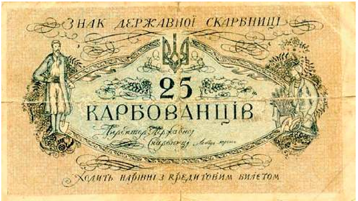
Паперові гроші - знаки Державної скарбниці 1918 - 1920 років випуску - вартістю 25 гривень (карбованців). Інтернет ресурс.