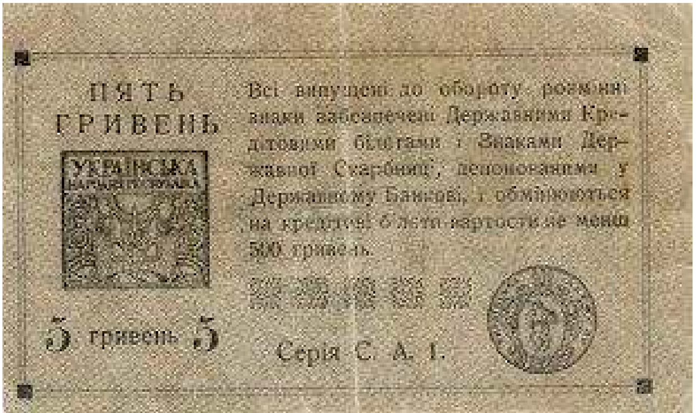
Паперові гроші - знаки Державної скарбниці 1918 - 1920 років випуску - вартістю 5 гривень (карбованців). Інтернет ресурс.