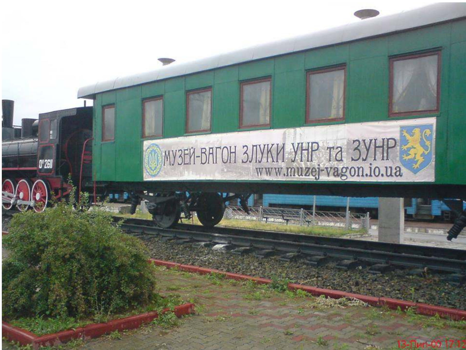
Вагон-музей злуки УНР та ЗУНР, м. Фастів, 08 березня 2016 року.