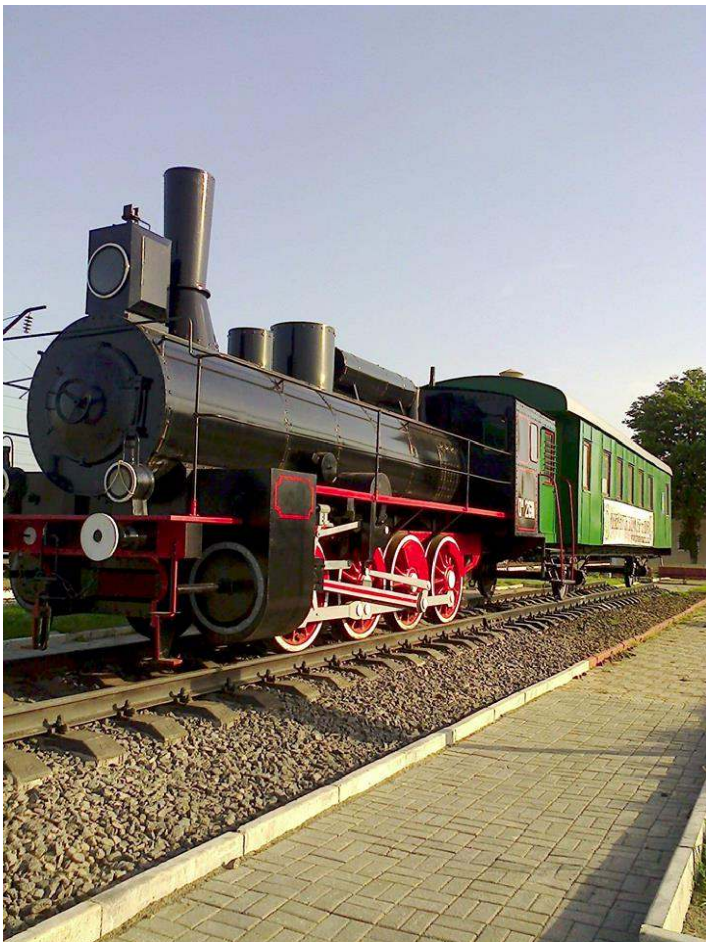
Вагон-музей злуки УНР та ЗУНР, м. Фастів, 02 січня 2016 року. Веб-сайт вагону-музею злуки УНР та ЗУНР ( http://io.ua/33526059 ).