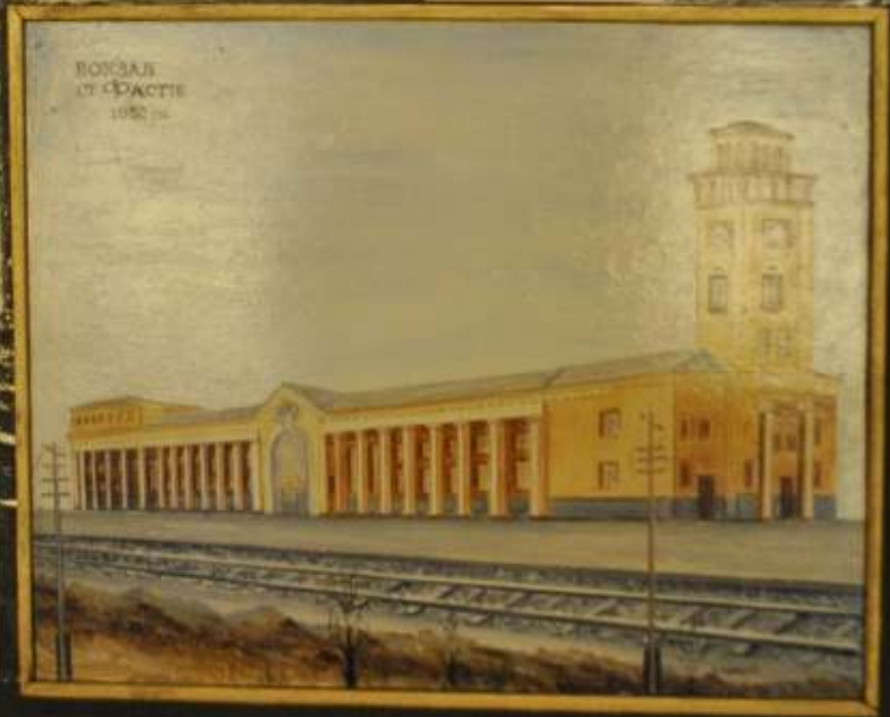
Експозиція вагону-музею злуки УНР та ЗУНР, м. Фастів, 08 березня 2014 року. Веб-сайт вагону-музею злуки УНР та ЗУНР ( http://io.ua/27591141 ).