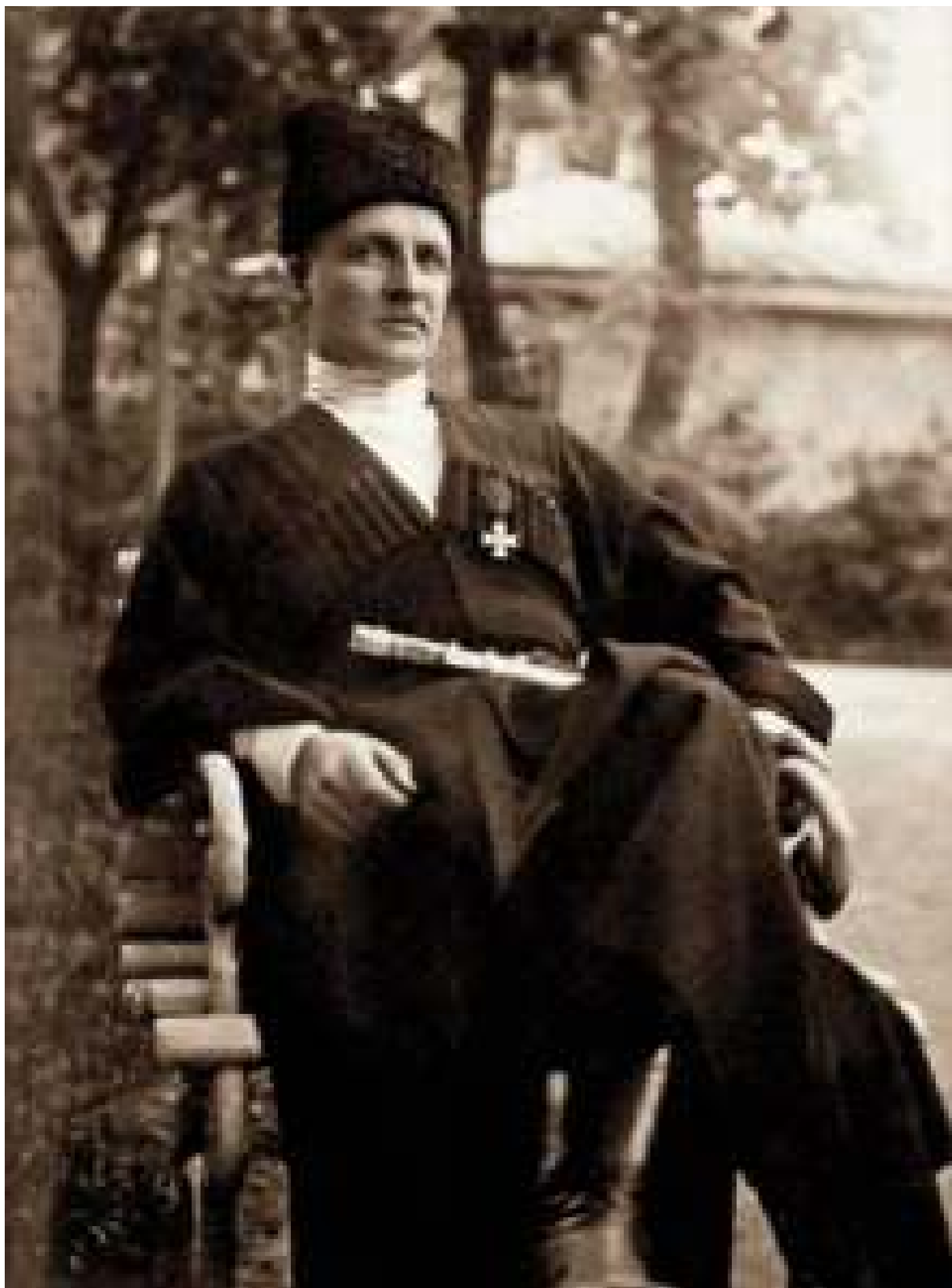
Скоропадський Павло Петрович - Гетьман Всієї України з 29 квітня 1918 року по 14 грудня 1918 рік. Інтернет ресурс.