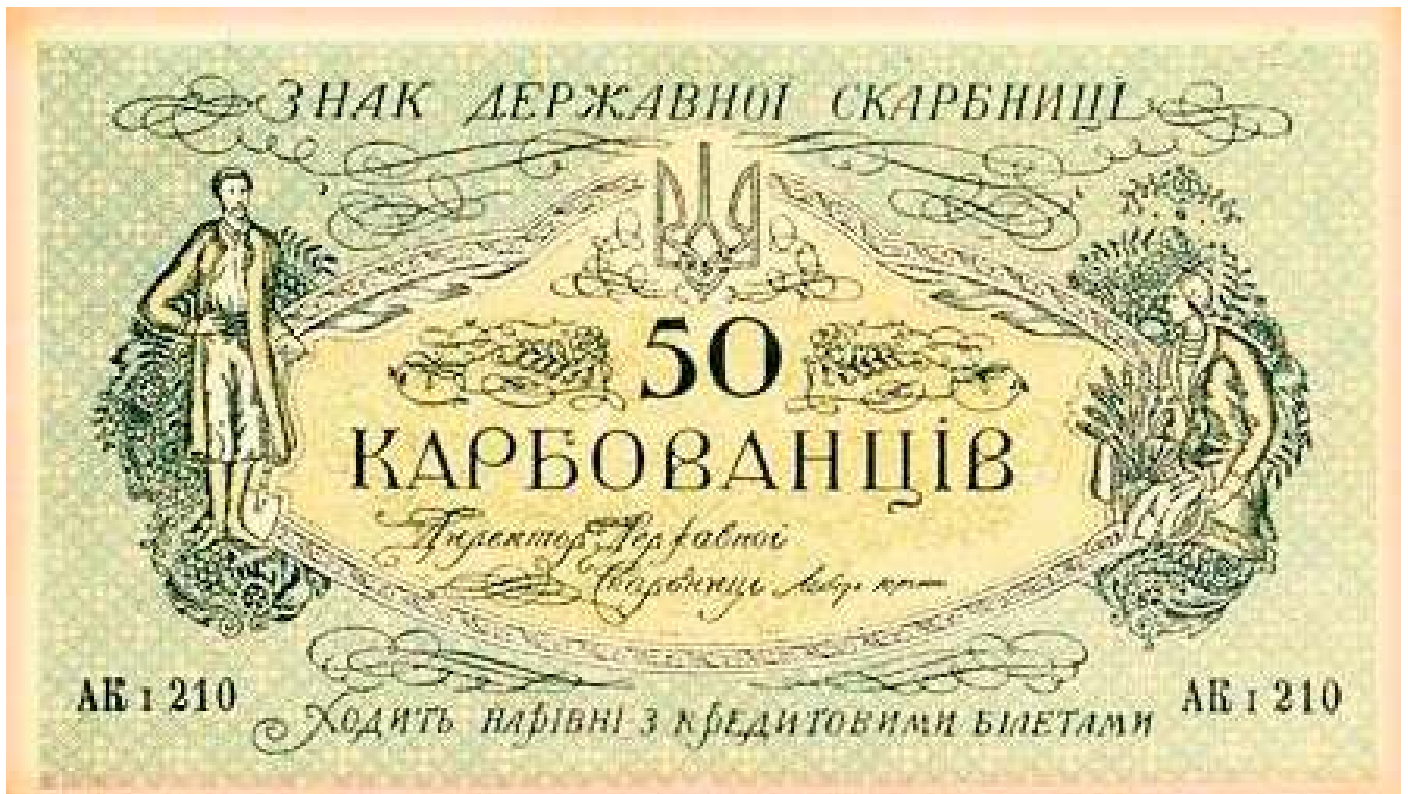
Паперові гроші - знаки Державної скарбниці 1918 - 1920 років випуску - вартістю 50 гривень (карбованців). Інтернет ресурс.