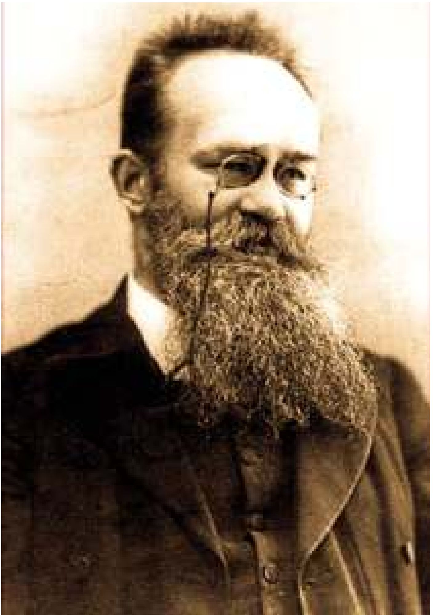
Грушевський Михайло Сергійович - Голова Української Центральної Ради УНР з 27 березня 1917 року по 29 квітня 1918 рік. Інтернет ресурс.