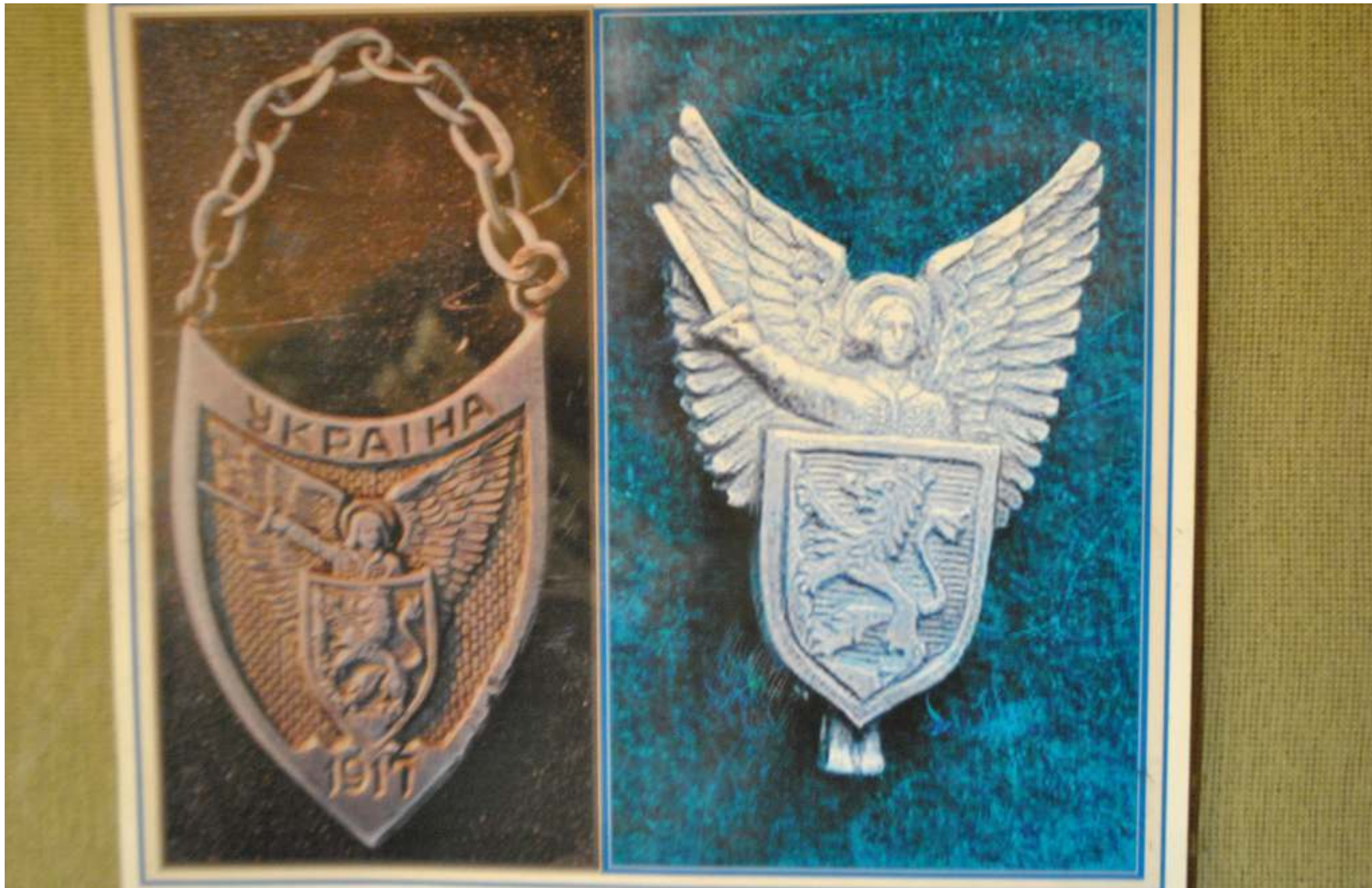
Експозиція вагону-музею злуки УНР та ЗУНР, м. Фастів, 08 березня 2014 року.