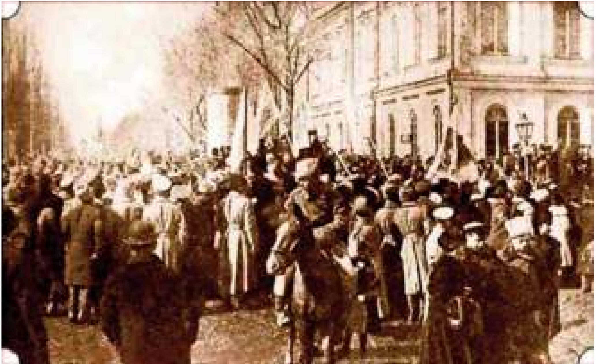
Відзначення проголошення УНР. Київ. Інтернет ресурс.