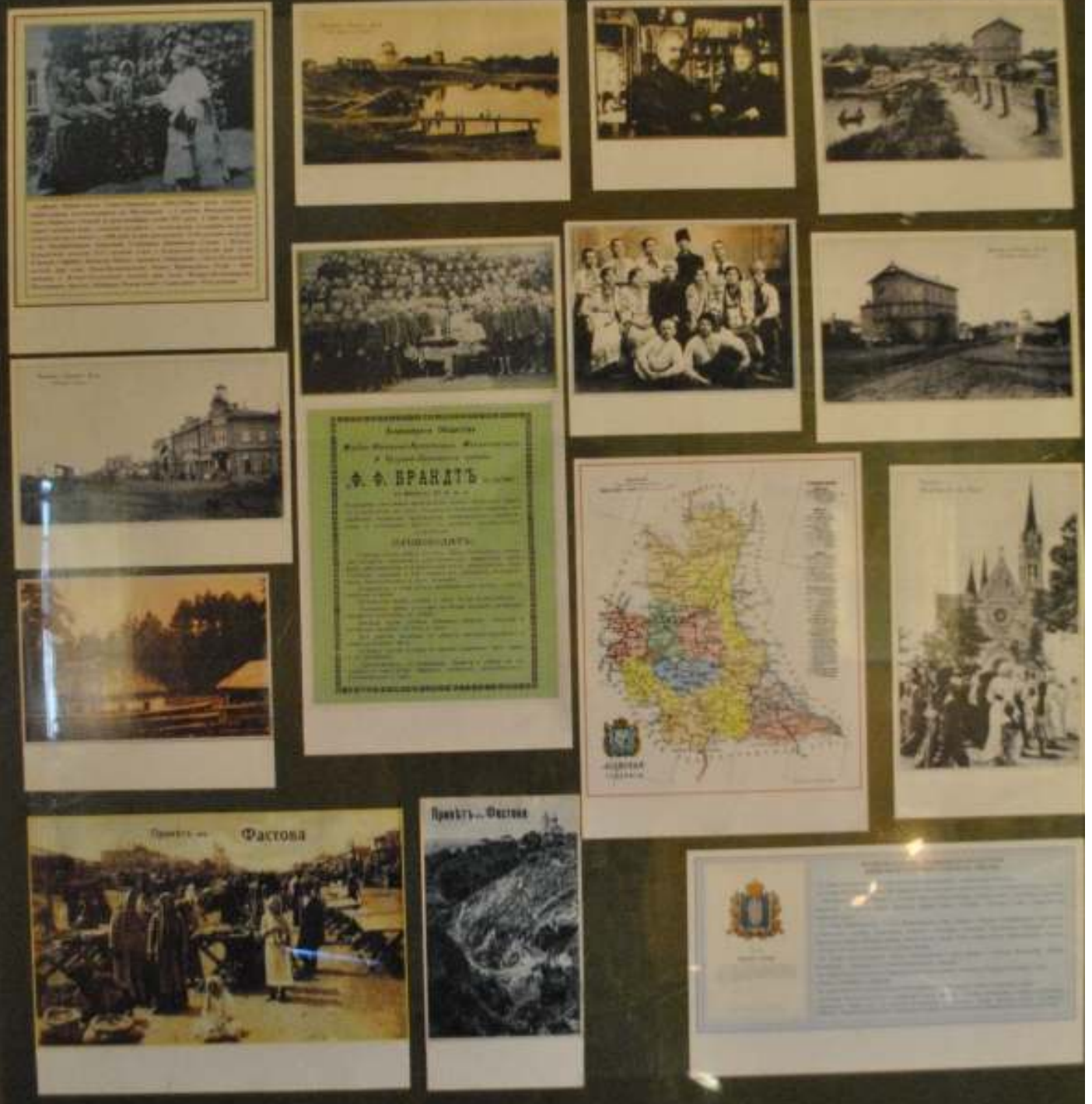
Експозиція вагону-музею злуки УНР та ЗУНР, м. Фастів, 08 березня 2014 року.