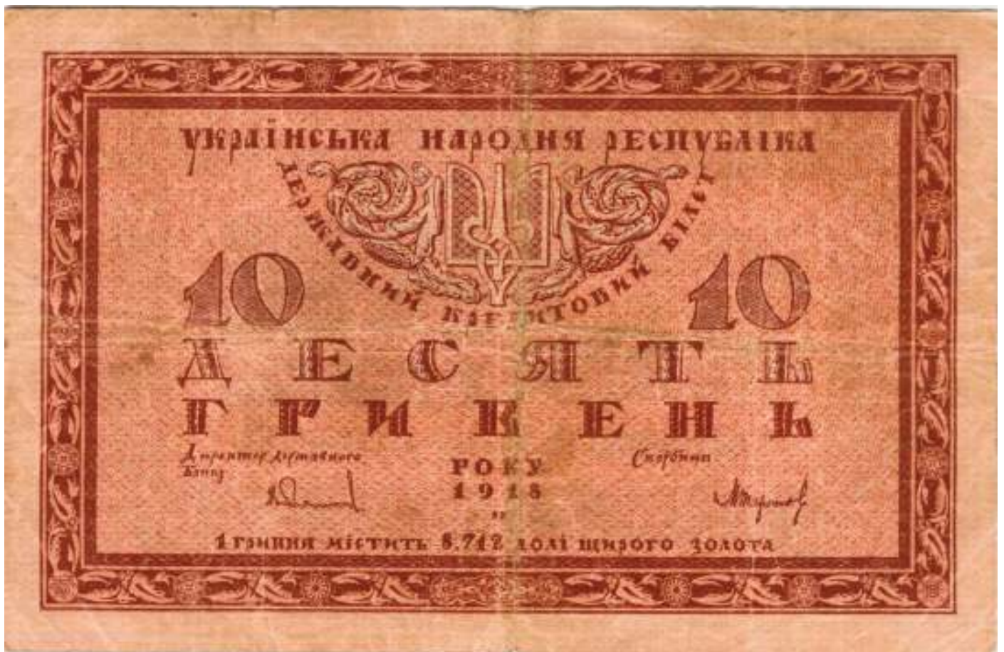
Паперові гроші - знаки Державної скарбниці 1918 - 1920 років випуску - вартістю 10 гривень (карбованців).