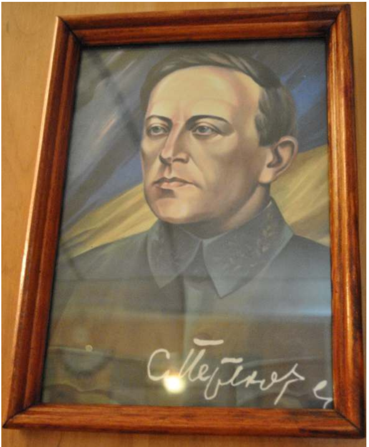
Експозиція вагону-музею злуки УНР та ЗУНР, м. Фастів, 08 березня 2014 року.