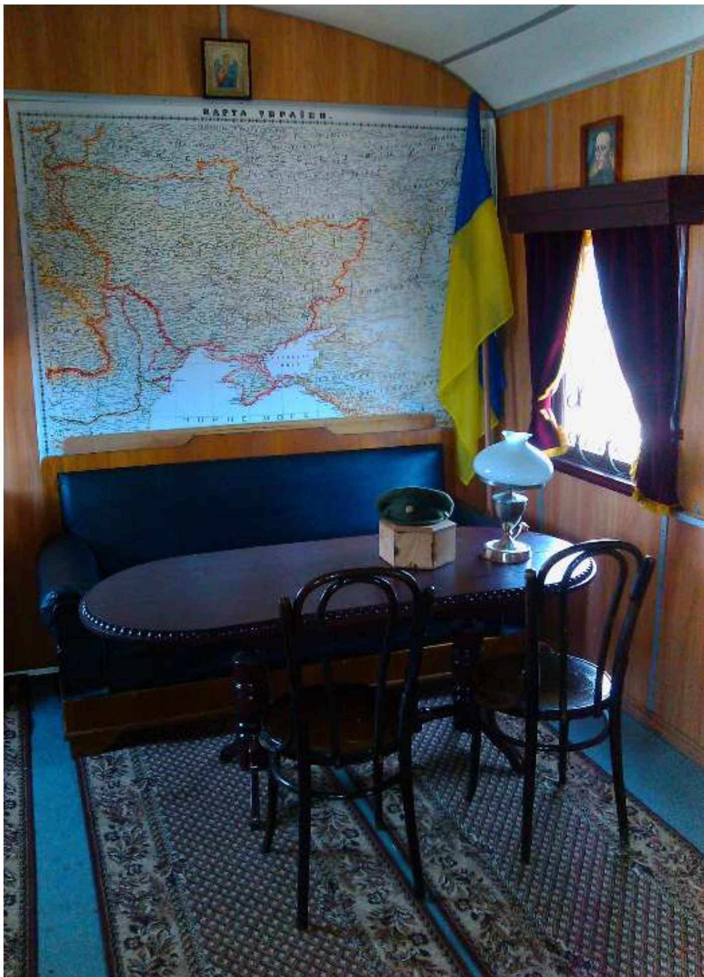
Експозиція вагону-музею злуки УНР та ЗУНР, м. Фастів, 23 березня 2014 року. Веб-сайт вагону-музею злуки УНР та ЗУНР ( http://io.ua/27624002p ).