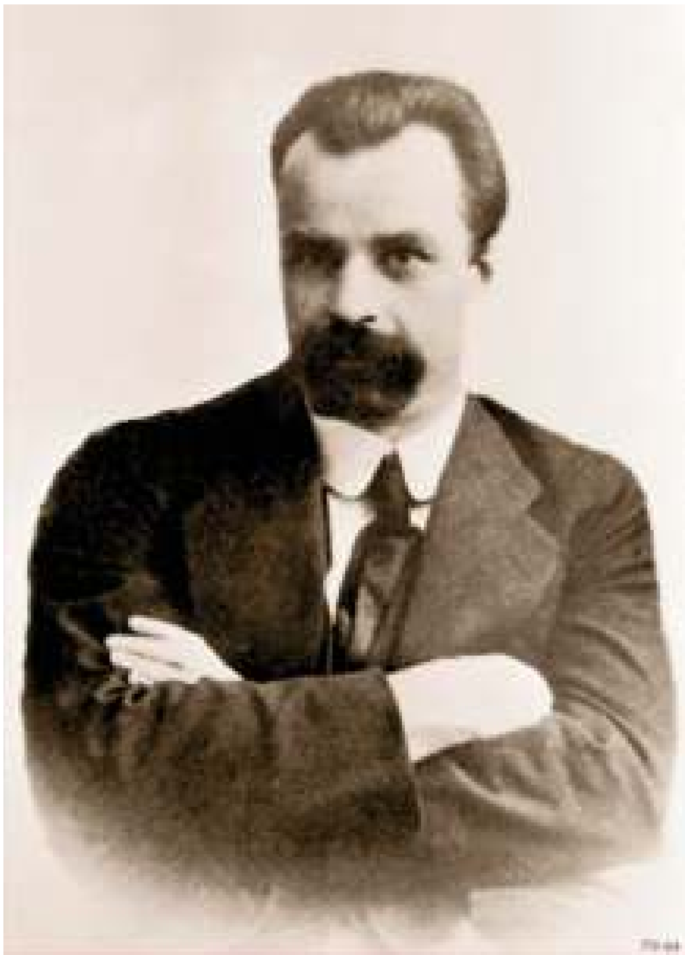
Винниченко Володимир Кирилович - Голова Генерального Секретаріату Української Центральної Ради у червні 1917 року - січні 1918 року. Інтернет ресурс.