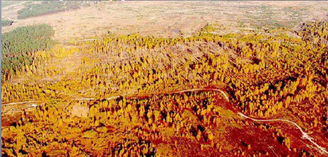
Рудий ліс біля Чорнобиля